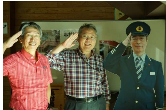
志村駅長と出発進行～！？