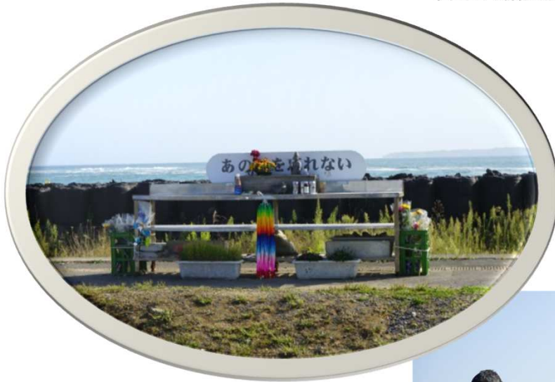
大谷海岸駅ホームの献花台