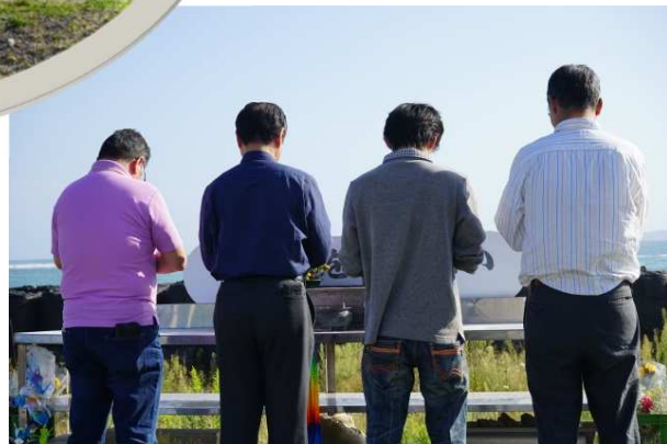
献花台前でご冥福をお祈りいたしました