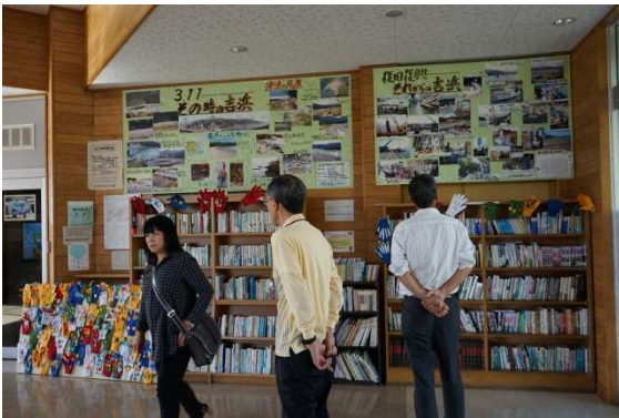
9/28 大船渡市三陸町吉浜駅内