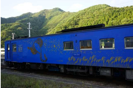
花巻 ⇄ 釜石 を走るSL銀河