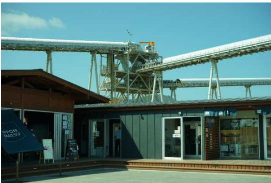
陸前高田の一本松茶屋