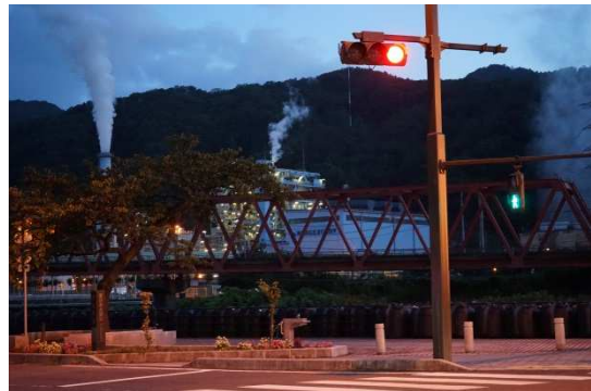
釜石製鉄所の夜景