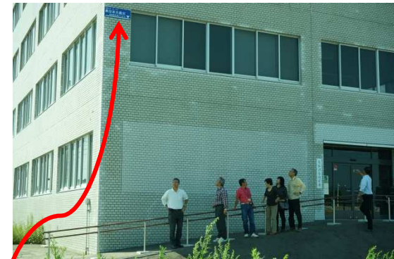
気仙沼庁舎(写真の左上の青い線迄津波が到達したとの事)